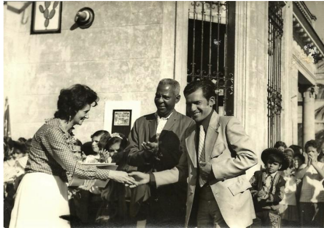
Saludo a la directora del plantel

El festival llevó el nombre “Así es México” y en muchos sentidos me sorprendió el grado de conocimiento que se tenía de mi país: historia, costumbres, canciones y hasta modismos. Se desarrolló un programa que comprendía algunas declamaciones por parte de alumnos y la ejecución de bailes mexicanos bastante bien ejecutados, vistiendo trajes típicos adecuados a la ocasión.