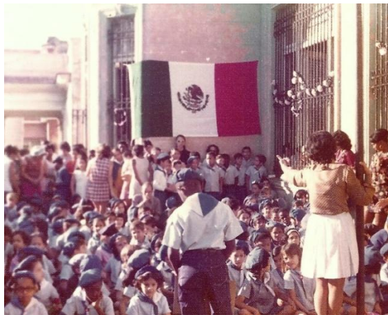
Alumnos asistentes a la ceremonia

Por mi parte, pronuncié unas palabras para agradecer el esfuerzo de maestros y alumnos para preparar la representación de que fui testigo; sabiendo de lo difícil que pudo haber sido conseguir todo lo necesario, en una sociedad en la que resaltaban carencias materiales y de otro tipo; así como las dificultades para la comprensión de una cultura distinta, tan cercana y tan distante al mismo tiempo. Francamente quedé cautivado por aquellos profesores y alumnos, que con tan poco hicieron mucho.