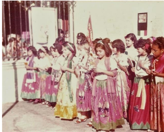
Alumnas luciendo trajes típicos mexicanos