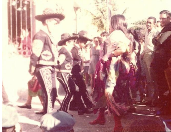
Grupo de alumnos ejecutando un baile mexicano

Los niños ya sean cubanos, guatemaltecos o mexicanos, muestran sentimientos nobles y son capaces de dar calidez a las expresiones de otros pueblos, a través de las canciones, bailes, poesías o pensamientos.