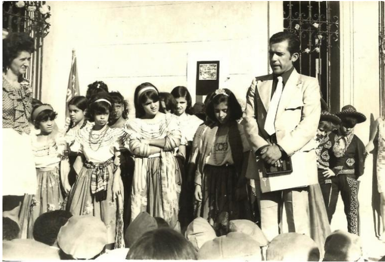
Hablando a niños y maestros

Por mi parte, pronuncié unas palabras para agradecer el esfuerzo de maestros y alumnos para preparar la representación de que fui testigo; sabiendo de lo difícil que pudo haber sido conseguir todo lo necesario, en una sociedad en la que resaltaban carencias materiales y de otro tipo; así como las dificultades para la comprensión de una cultura distinta, tan cercana y tan distante al mismo tiempo. Francamente quedé cautivado por aquellos profesores y alumnos, que con tan poco hicieron mucho.