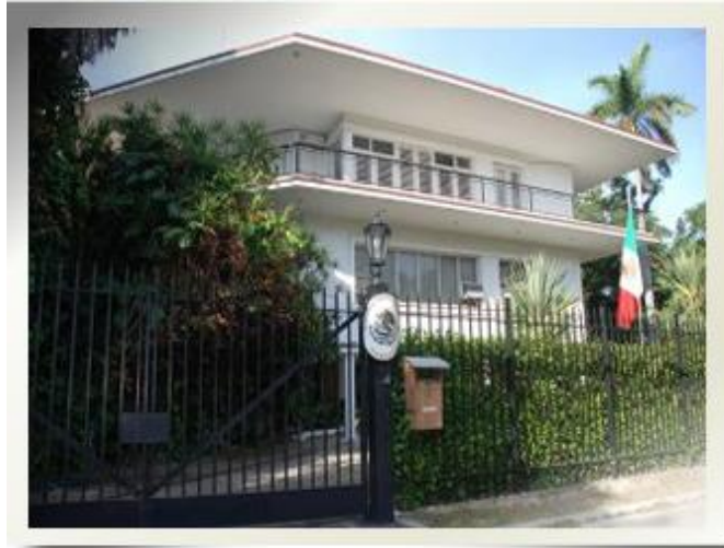
Oficinas de la Embajada de México en La Habana

Por esos tiempos en las oficinas de la embajada se trabajaba en dos jornadas (mañana y tarde) de lunes a viernes y el sábado solo por la mañana. Todavía el día de mi llegada hubo tiempo para pasar a conocer a los compañeros de trabajo, aunque el embajador no llegó.